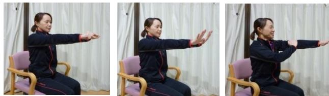
手指・足指グーパーと腕・足さすり