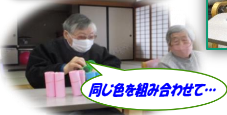
同じ色を組み合わせて...