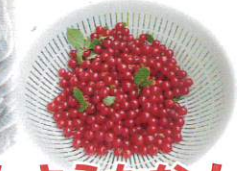
木の実を取ったらジャムにしようかな!