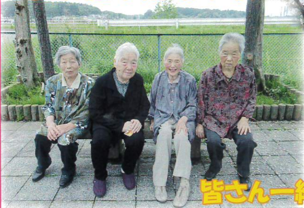
皆さん一緒!! ハイ! ポーズ!