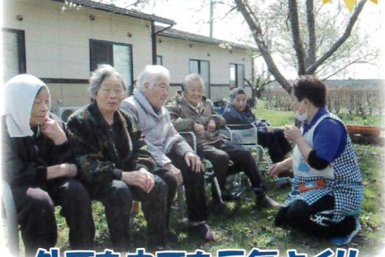
外でも中でも元気よく!!